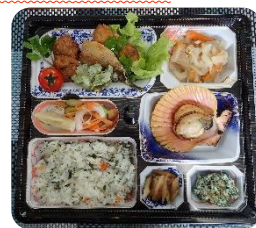
※こちらはモニターツアー一時のものです。 内容は、季節によって 変更になる場合がございます。