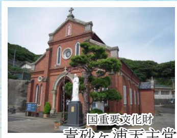
国重要文化財 青砂ヶ浦天主堂