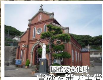
国重要文化財 青砂ヶ浦天主堂