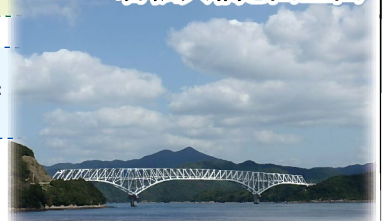
若松大橋と山王山